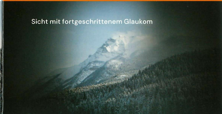
Sicht mit fortgeschrittenem Glaukom

Nein, die SLT-Behandlung ist völlig schmerzfrei.